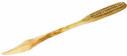
Ryc. 8. Szczoteczka z 2. poł. XIX wieku, z końcówką do czyszczenia paznokci (?). Fot. A. Czuba.

Najbardziej liczną grupą z tych najmłodszych (sześć zachowanych w całości – w tym jedna z włosiem, a także jeden uchwyt) są szczoteczki o lekko zwężających się główkach, z zaokrąglonymi końcówkami rękojeści. Główki zostały wyraźnie wyodrębnione od rękojeści dużym przewężeniem – Ryc. 7. Otwory do osadzenia włosów wywiercono w trzech rzędach. Wszystkie szczoteczki z tej grupy mają praktycznie takie same wymiary; ich długość wynosi 14,4-14,6 cm; szerokość główek: 0,8-0,9 cm; szerokość uchwytów (rękojeści): 0,9-1,0 cm.