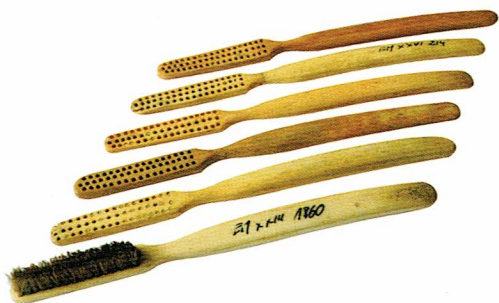
Ryc. 7. Szczoteczki, wyrób fabryczny z 2. poł. XIX wieku.

analizowany zbiór tych przedmiotów rozwarstwić chronologicznie. Na pięciu z nich zachowały się napisy informujące o miejscu ich produkcji. Na tej podstawie oraz na różnicach ich kształtu i wielkości można stwierdzić, że szczoteczki datowane na drugą połowę XIX wieku pochodzą przynajmniej z kilku wytwórni.