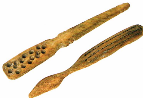
Ryc. 1. Szczoteczki z 2. poł. XVIII wieku, wyrób rzemieślniczy.

Te najstarsze szczoteczki były wytwarzane prawdopodobnie jeszcze w warsztatach rzemieślniczych, część być może w manufakturach. Mogą o tym świadczyć mało znormalizowane wymiary i kształty poszczególnych egzemplarzy, a także widoczne i czytelne ślady nacinania rowków ułatwiających umocowanie włosia na górnych powierzchniach główek i otwory przewiercone na wylot.