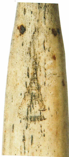
Ryc. 17. Wizerunek wieży Eiffla i napis TOUR EIFFEL – zbliżenie.

w języku francuskim: premiere qualite garantie (Ryc. 14). Na kolejnej (także zachowanej jedynie jako fragment rękojeści) umieszczono ujęty w dwa krzyże maltańskie napis EXCELSIOR (Ryc. 15).