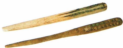
Ryc. 2. Szczoteczki z końca XVIII wieku, wyrób manufaktury. Fot. A. Czuba.

Najmniejsza z dotychczas odkrytych szczoteczek ma 7,9 cm długości. Została wykonana na wyższym poziomie technicznym od poprzednio opisanej. Na główce (długość: 4,6 cm, szerokość: 0,9 cm) wywiercone zostały otwory w trzech rzędach, przesuniętych w stosunku do siebie. Ponadto główka została ukształtowana łukowato, a krótka rączka posiada kształt ułatwiający trzymanie w ręce – Ryc. 1:2. Na podstawie lepszego poziomu wykonania można tą szczoteczkę datować na okres bliżej końca XVIII wieku.