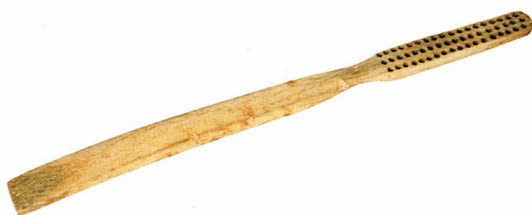
Ryc. 9. Szczoteczka o prosto zakończonym uchwycie, z 2. poł. XIX wieku.