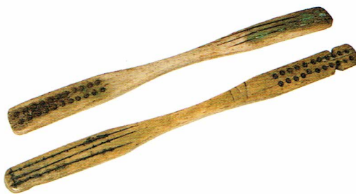
Ryc. 3. Szczoteczki podwójne z końca XVIII lub przełomu XVIII i XIX wieku.

ciwgle 2 . Na jednej z główek otwory do osadzenia włosów rozmieszczone są w trzech rzędach, na główce z drugiego końca każdej z tych szczoteczek – w dwóch rzędach – Ryc. 3. Długość całkowita wynosi 14,1-14,2 cm, główki mają szerokość od 1,1 do 1,3 cm. Wszystkie te cechy metryczne i techniczne pozwalają przypuszczać, że zostały one wytworzone w jednej manufakturze (?).