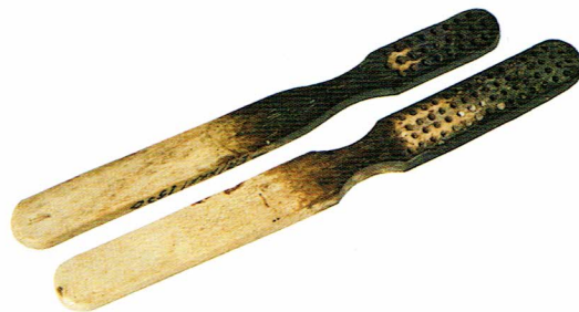
Ryc. 6. Szczoteczki do zębów z XIX wieku.

dwie, o identycznych wymiarach – długość 8,9 cm, szerokość 1,4 cm i zaokrąglonych końcach, to szczoteczki pozbawione uchwytów – Ryc. 5. W przekroju podłużnym są lekko łukowate a na jednej z powierzchni, na całej długości, zostały nawiercone w czterech rzędach otwory do osadzenia włosa. Kształt i wielkość tych szczoteczek powodują duże wątpliwości związane z określeniem ich funkcji. Być może należy je raczej identyfikować jako szczoteczki do pielęgnacji paznokci.