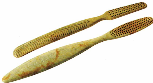
Ryc. 10. 1 – szczoteczka z początku XX wieku; 2 – szczoteczka z ornamentem „jodelki” na uchwycie, koniec XIX wieku.

Inna szczoteczka, znacznie mniejsza, o długości 12,1 cm, i bardziej delikatna od wyżej opisanych, ma odmienną od pozostałych końcówkę uchwytu, przystosowaną prawdopodobnie do czyszczenia paznokci – Ryc. 8. Identyczna została odnaleziona również w Gdańsku [Kowalski 2005, ryc. 3; 4; 5]. Kolejnym pojedynczym odkryciem jest szczoteczka o długości 14,9 cm, lekko zwężającej się główce i prosto zakończonym uchwycie oraz z otworami do osadzenia włosów wywierconymi w trzech rzędach – Ryc. 9. Inna (być może należy ją, jako jedyną, datować już na XX wiek) ma eliptyczną główkę z otworami do osadzenia włosów rozmieszczonymi w pięciu rzędach – Ryc. 10: 1. Długość całkowita tej szczoteczki wynosi 16,4 cm, a szerokość rękojeści – 1,7 cm. Jest ona największa w elbląskiej kolekcji.