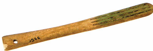
Ryc. 4. Szczoteczka z przełomu XVIII i XIX wieku.

Ostatnią szczoteczką z tej grupy jest okaz o niewyodrębnionej od rączki główce, w której nawiercone zostały trzy rzędy otworów do osadzenia włosów. W dolnej części rękojeści został wywiercony otwór, który mógł służyć do zawieszenia. Ta szczoteczka ma 13,1 cm długości i szerokość od 1,1 do 1,3 cm – Ryc. 4. Widoczne na niej ślady pozwalają sądzić, że została ona wykonana przy użyciu narzę-