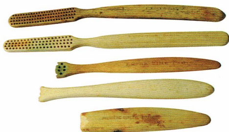
Ryc. 11. Szczoteczki i fragmenty szczoteczek z napisami na rękojeściach, koniec XIX-początek XX wieku. Fot. A. Czuba.

Również pojedynczym znaleziskiem jest kolejna szczoteczka o zwężającej się główce i otworach do sadzenia włosia w czterech rzędach. Jej długość całkowita wynosiła 15,4 cm. Rękojeść o szerokości 1,3 cm została pokryta po obu stronach rytym „ornamentem” jodełkowym, co zapewniało lepsze jej trzymanie w dłoni – Ryc. 10: 2. Taki sposób „ozdobienia” wyróżnia ją od pozostałych odkrytych w Elblągu oraz w Gdańsku.