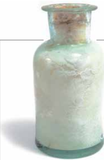
Naczynko z wodorotlenkiem lub tlenkiem wapnia

Kolejna grupa to substancje z zawartością związków organicznych i metalo-organicznych, które określono, badając na podstawie próby na obecność atomu azotu. Dzięki temu udało się określić, że w jednej z butelek, zawierających gęstą ciec zblizoną zapachem do terpentyny, znajdował się prawdopodobnie pewien rodzaj mieszanki o właściwościach wykrztuśnych, być może żywica sosnowa. Mogła ona być m.in. składnikiem dość powszechnego w XVII w. medykamentu na różnego rodzaju dolegliwości, czyli plastra zwanego Łaską Bożą – oprócz żywicy sosnowej, dodawano sok z biedrzyca (m.in. anyżek, działa odkażająco i wykrztuśnie), werbeny (roślina o właściwościach leczniczych, na przeziębienia, działa uspokajająco), bukwy (na dolegliwości żołądkowe, na