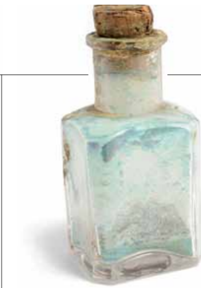
Naczynko z zawartością miedzi

O zastosowaniu niektórych wspomnianych wcześniej substancji może