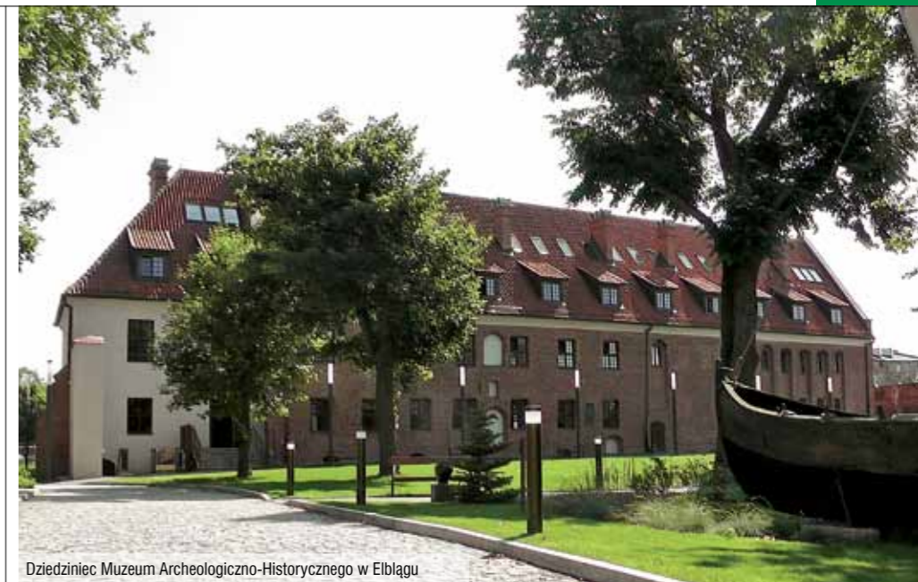
Dziedziniec Muzeum Archeologiczno-Historycznego w Elblągu

Kolejnym odkrytym „lekiem” był malachit , minerał stosowany w leczeniu już od czasów starożytnych jako