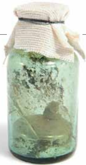
Naczynko apteczne z rtęcią

przez Radę Miasta 30 lipca 1668 r., w którym wymienia się metale i minerały wydobywane z ziemi, m.in. miedź, rtęć, kredę i gips. Podobne, lecznicze właściwości miał odwar lub guma z drzewa gwajakowego, która również znalazła się wśród zachowanych substancji leczniczych (stosowano ją także jako środek wykrztuśny i udrażniający drogi oddechowe, a źródła podają korę gwajakową z drzew rosnących w Ameryce Południowej jako lekarstwo o właściwościach moczopędnych i napotnych).